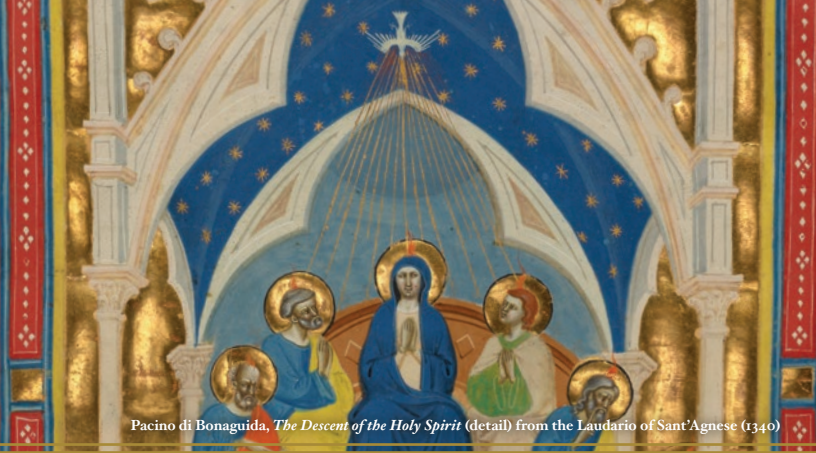
Pacino di Bonaguida, The Descent of the Holy Spirit (detail) from the Laudario of Sant'Agnese (1340)