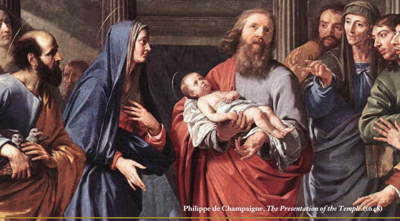
Philippe de Champaigne, The Presentation of the Temple (1648)