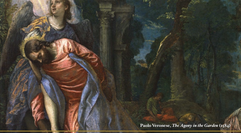
Paolo Veronese, The Agony in the Garden (1584)