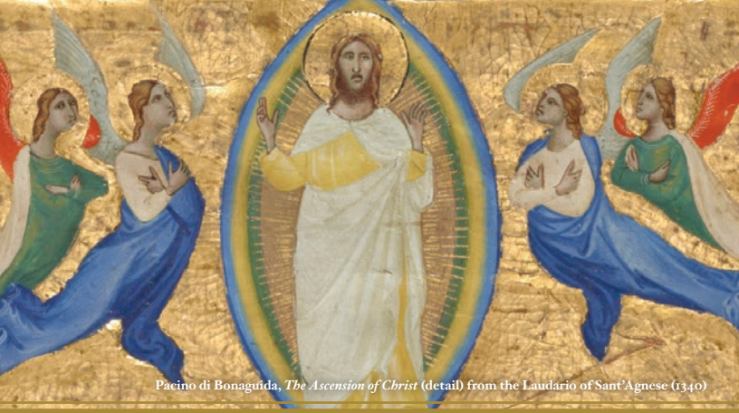
Pacino di Bonaguida, The Ascension of Christ (detail) from the Laudario of Sant'Agnese (1340)