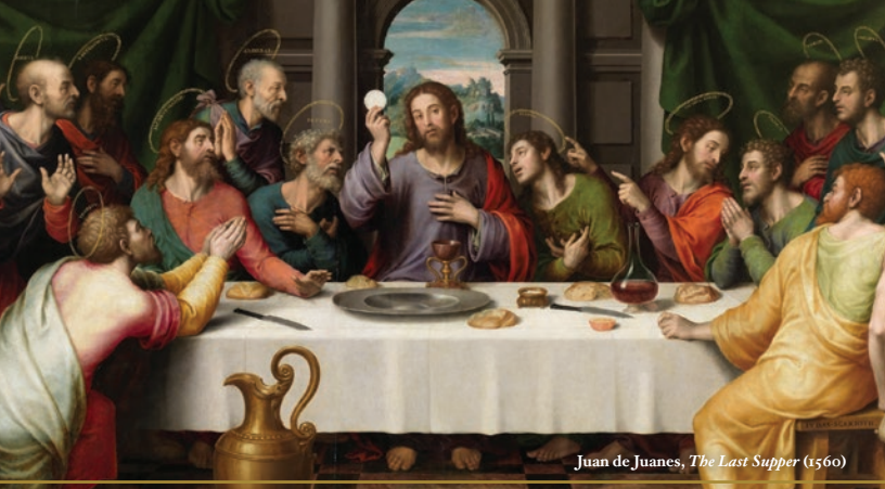
Juan de Juanes, The Last Supper (1560)