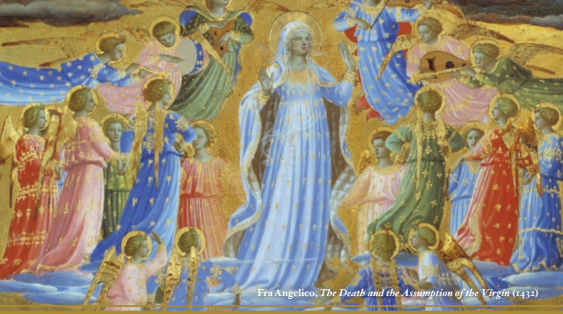
Fra Angelico, The Death and the Assumption of the Virgin (1432)