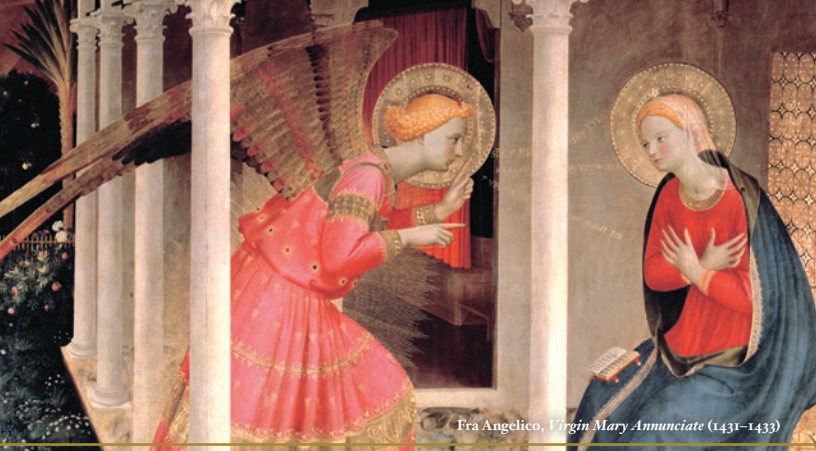
Fra Angelico, Virgin Mary Annunciate (1431–1433)