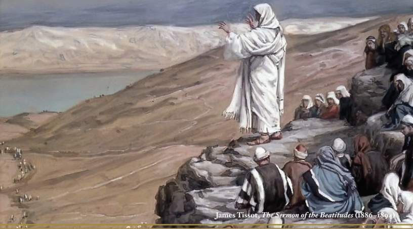
James Tissot, The Sermon of the Beatitudes (1886-1894)