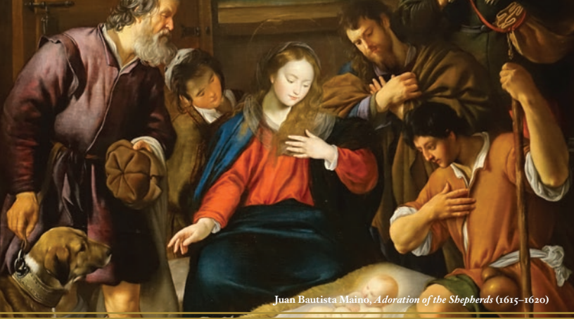
Juan Bautista Maino, Adoration of the Shepherds (1615–1620)