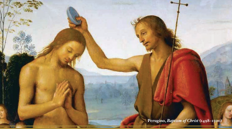
Perugino, Baptism of Christ (1498–1500)