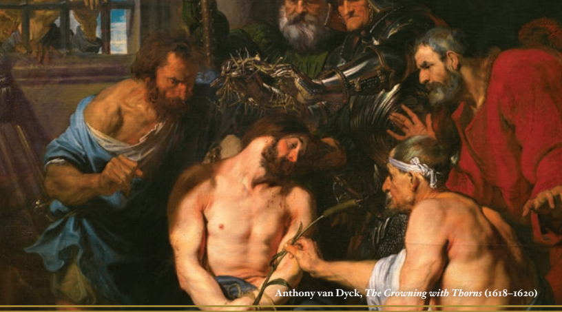
Anthony van Dyck, The Crowning with Thorns (1618–1620)