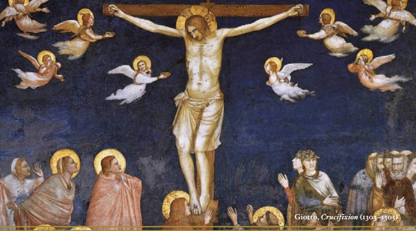
Giotto, Crucifixion (1303-1305)