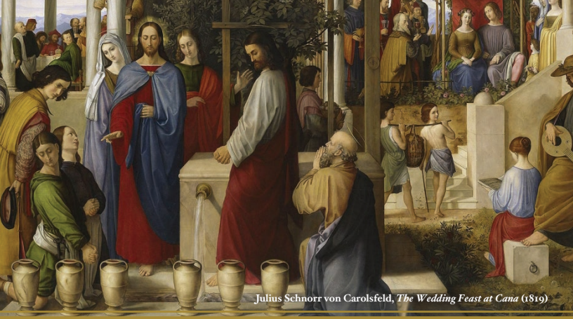
Julius Schnorr von Carolsfeld, The Wedding Feast at Cana (1819)