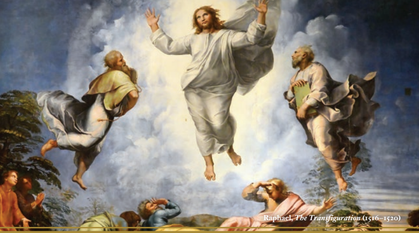
Raphael, The Transfiguration (1516–1520)