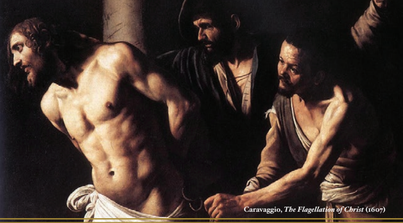
Caravaggio, The Flagellation of Christ (1607)