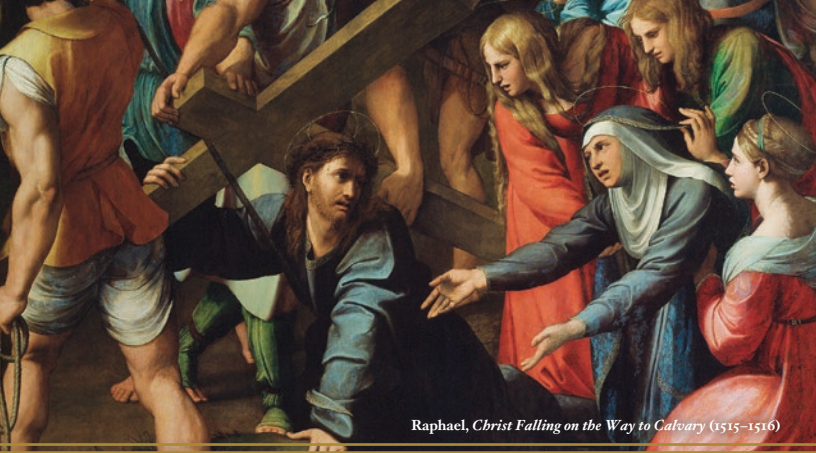
Raphael, Christ Falling on the Way to Calvary (1515–1516)