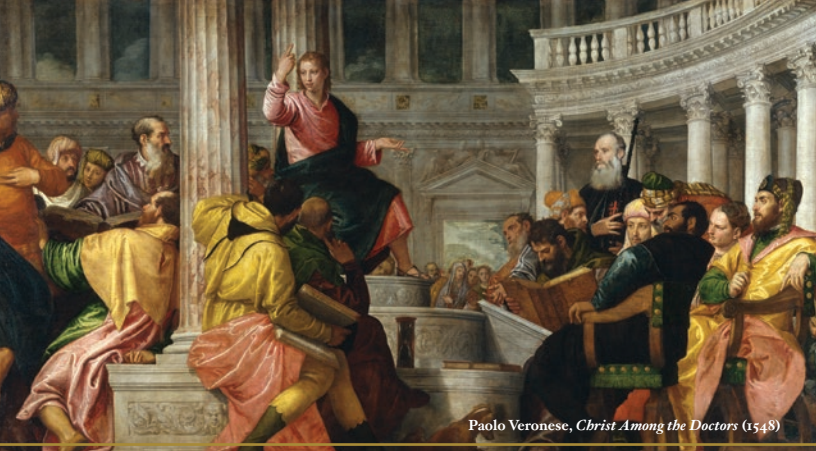
Paolo Veronese, Christ Among the Doctors (1548)